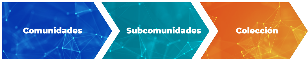
Gráfico N° 3: Organización de los contenidos en un RI

La decisión del modo como las colecciones son establecidas dentro de las comunidades también debe ser tomada en concordancia con la política del repositorio y puede variar según la comunidad.